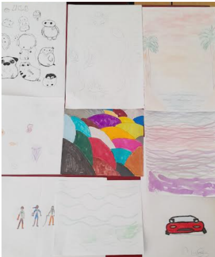
Dibujos hechos por los estudiantes mientras oían la lectura.