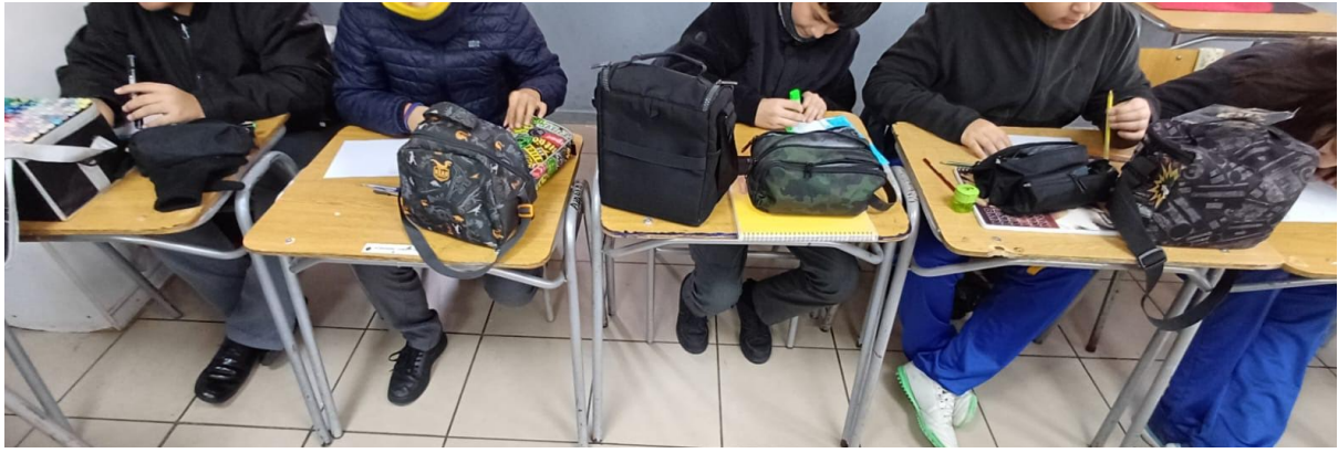
Foto de estudiantes dibujando mientras oyen el texto