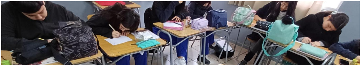
Foto de los niños redactando sus preguntas.

-Finalización: círculo para compartir la reflexión ante la pregunta ¿Qué hicimos hoy?