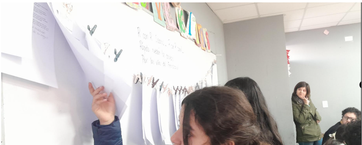
Niñas seleccionando una pregunta hecha por un compañero para responder.